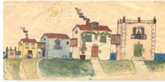
Scuola di Specializzazione in NPI